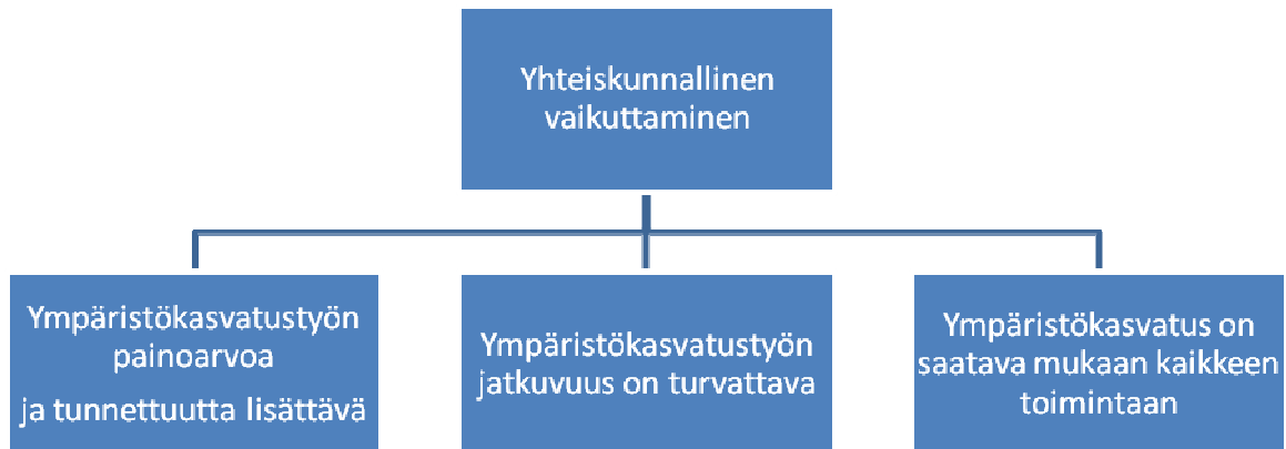
Kaavio 2: Yhteiskunnallisen vaikuttamisen tavoitteet

Suomen ympäristökasvatuksen Seuran toiminnan keskeisiin tavoitteisiin kuuluu ympäristökasvatuksen edistäminen yhteiskunnallisen vaikuttamisen keinoin (ks. kaavio 2). Vuonna 2010 yhteiskunnallisen vaikuttamisen osa-tavoitteita olivat: